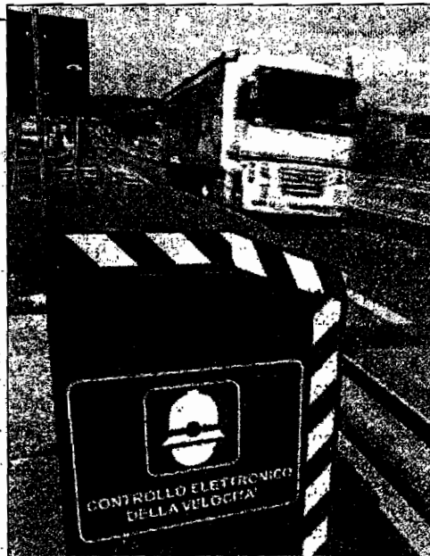
La postazione di uno speed-check

qualità ed economicità dei prodotti. Proprio per questo motivo sono state contattate tre aziende specializzate. Sulla base delle offerte pervenute in Comune è risultata vincitrice la ditta Aus Srl di Pieve Torina. Gli impiegati competenti si so-