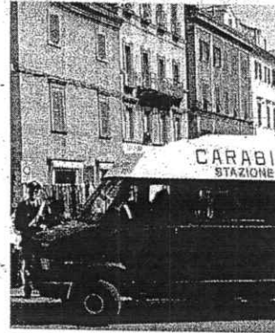
Un posto di controllo dell'Arma

Denuncia a Padiglione per un'auto sparita Una Bmw rubata al Borgo ritrovata in città